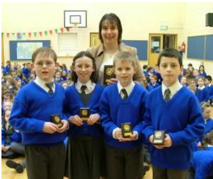
Comhghairdeas don fhoireann sóisearach a bhuaigh an chéad áit sa tráth na gceist eagraithe ag an gComhairle Creidmheasa ar an 6ú lá Feabhra.