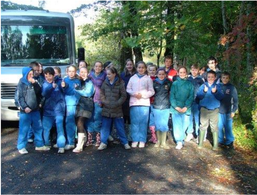
...agus Rang 5