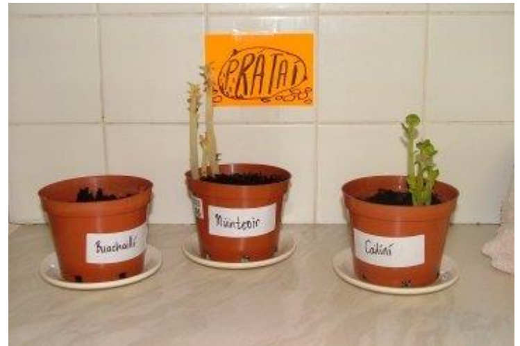
Taréis 10 lá

At this stage, it seems darkness gets the best results