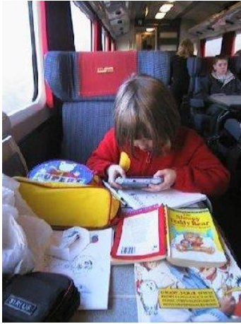
Ar an Traein Suas