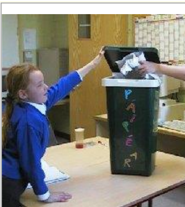
Athrothlú ar siúl

We gather up fruit skins and other biodegradable matter left over from lunch in the school. Children from Fifth Class collect it from the special containers left in each classroom, and bring it out to the compost bin every day.