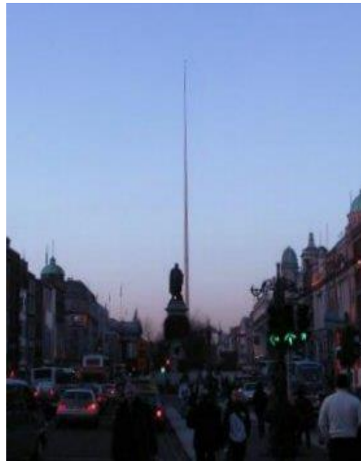
We had a look the Dublin Spire