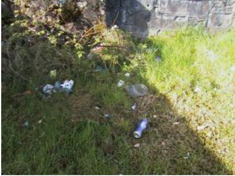
Seo pictiúr den chúinne atá taobh amuigh de bhalla na scoile, gar don abhainn.