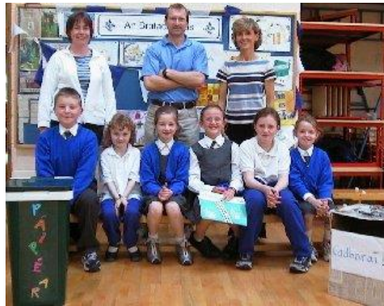
An Coiste 2002-2003

These are the steps taken in our quest to help everyone at Scoil Raifteirí understand better how to look after the environment