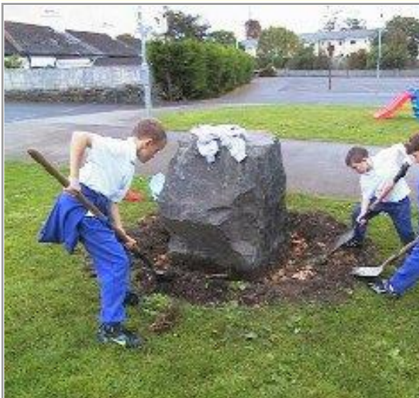
Ag Déanamh an scoil níos deise le bleibíní.