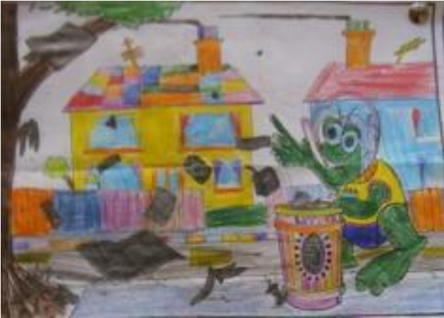
Dhathaigh Lycia, ó Rang Naíonáin Shinsearacha, an pictiúr seo.