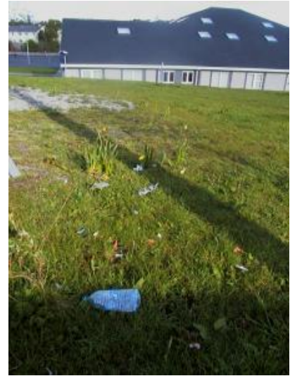
Abair slán leis an mbruscar. We'll try not to let the rubbish come back as badly ever again.

Dealáin álainn a rinne páistí sa scoil ar ábhar bruscair.