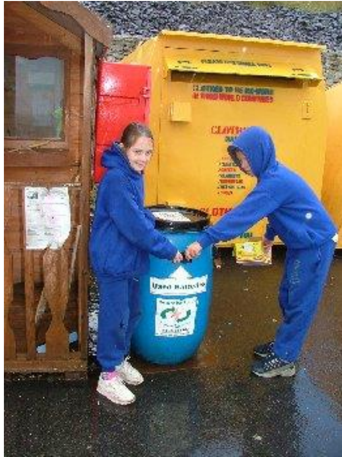
Turas go dtí Derrinumerá, Mí Meitheamh 2004, chun athrothlú a dhéanamh. Clic anseo chun pictiúirí a fheiceáil.