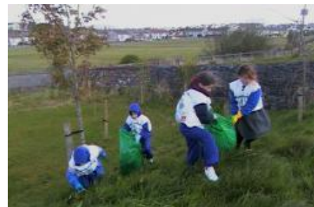
Rath Dé ar an Obair!