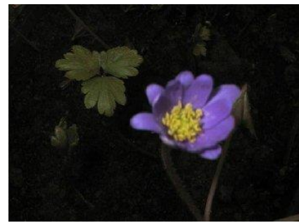
Anenome in bloom