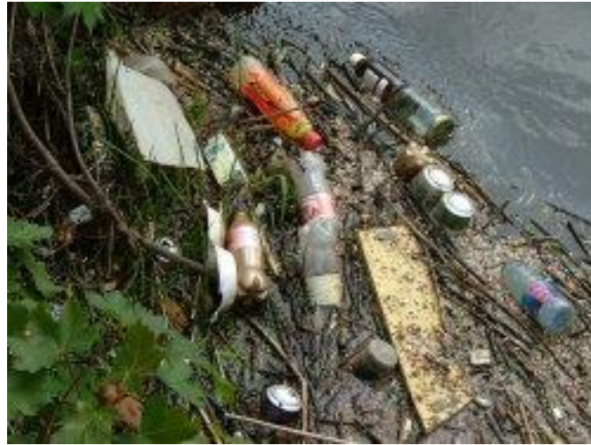
bruscar san abhainn