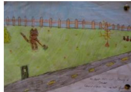
Rinne Tríona ó Rang 3 an pictiúr de de Oscar an Cat.