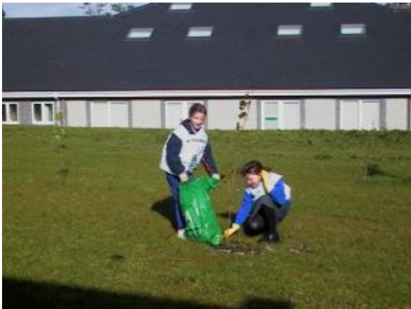
Tagann an-chuid salachair isteach ón tsráid.