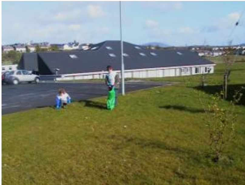
i mbun oibre

Agus muid ag iarraidh an Brat Glas a bhaint amach, agus allacht na scoile a choimeád glan, d'eagraigh Scoil Raifteirí lá lanacháin. Fuaireamar na málaí agus na bibs ón Taisce.