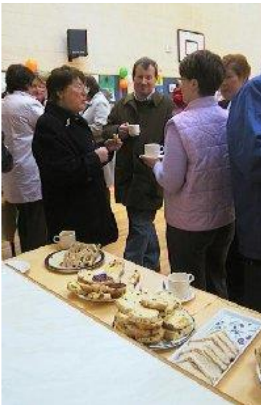
Bhí an cupán tae tuillte