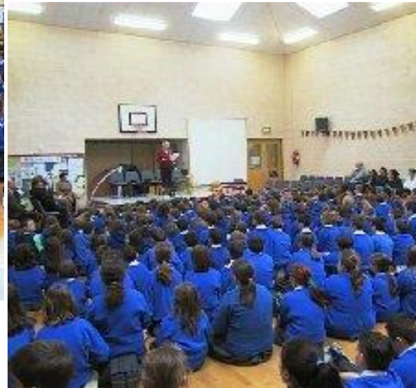
Máire Treasa ag eagrú rudaí