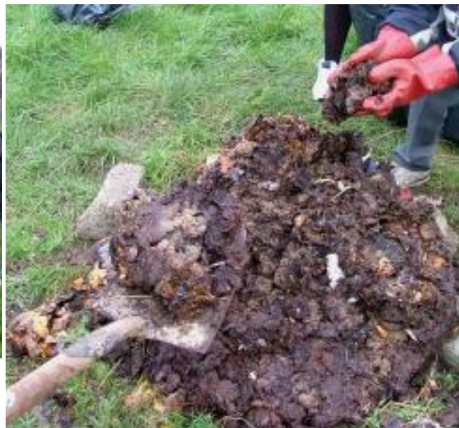
Nach bhfuil sé an-salach!