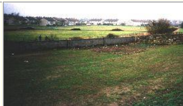
This is part of the field behind school.