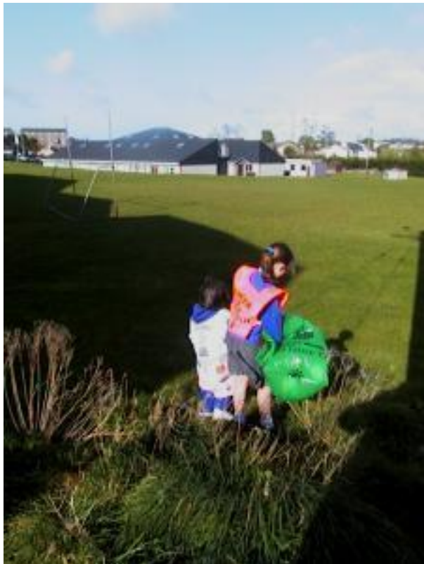
We'll have clean games of football after this work!