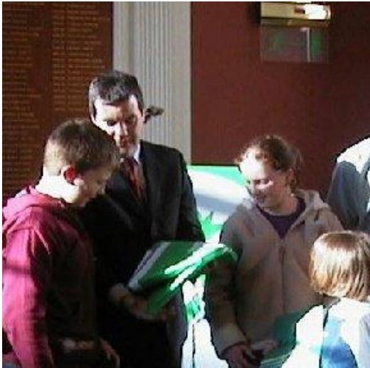
Minister for Education and Science, Noel Dempsey, presenting the flag.