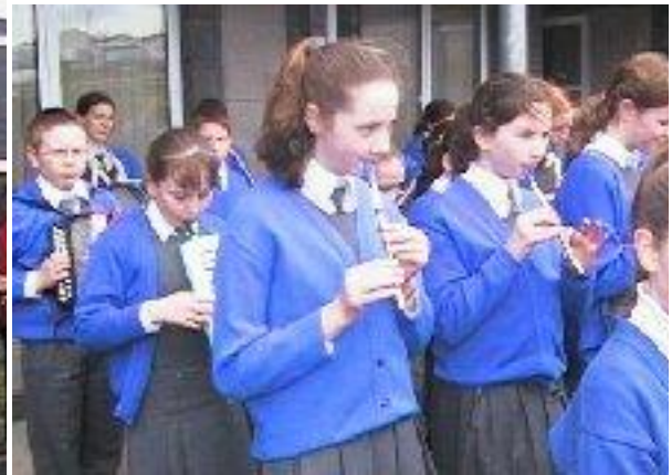
An Banna Ceoil