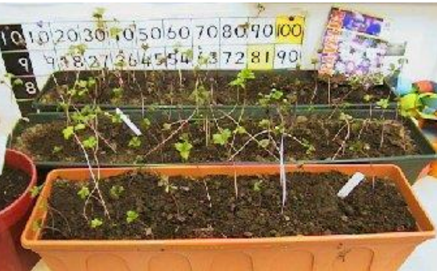
Anenomes ag fás sa seomra ranga