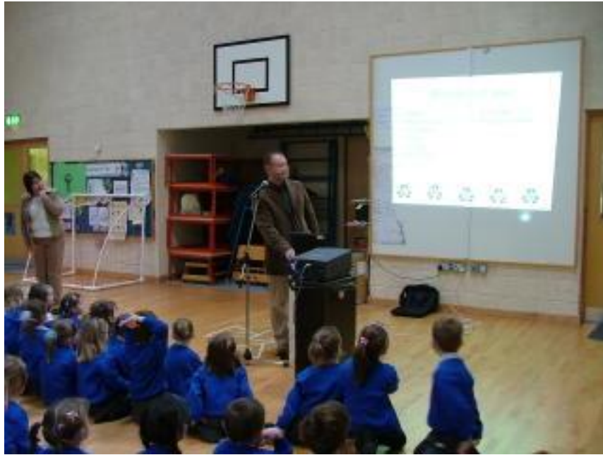
Tháinig TJ ón monarcha Coca Cola i mBéal an Átha chun labhairt linn faoin gcóras athchúrsáil atá ar siúl acu