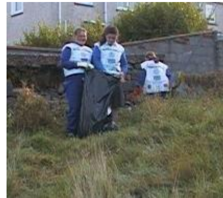
Glanadh ar siúl