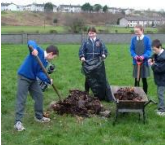
Thógamar muirín agus scaipeamar amach é timpeall na gcrann nua i Mí Feabhra