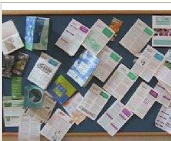
Eolas faoin timpeallacht