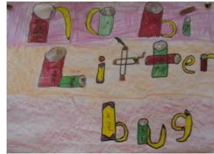
Taispeánann Sinéad ó Rang 2 na deas é an bruscar a chaitheamh tir - ach baineann sí úsáid as brusca é seo a rá dúinn!