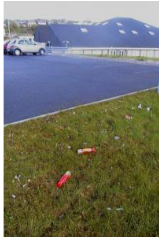
roimh an nglanadh