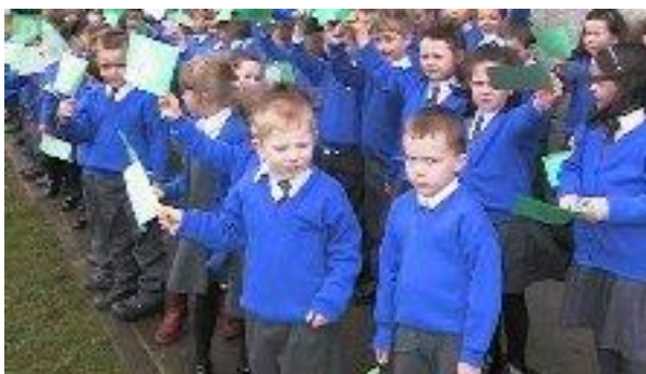
Na naíonáin agus na bratacha deasa