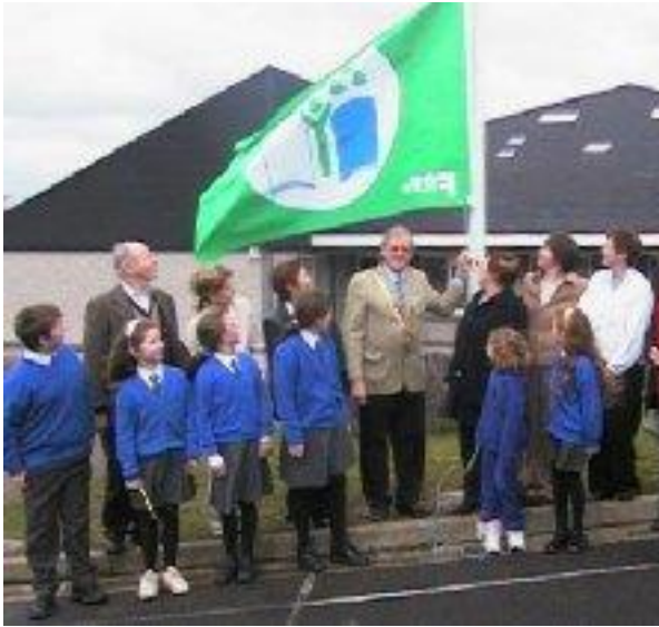
An Coiste os comhair na scoile