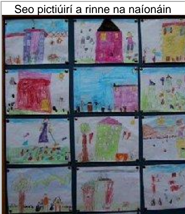
Seo pictiúirí a rinne na naonáin

Here are some of the excellent graphs printed out by fifth and sixth classes displaying information gleaned from the questionnaires they did on Transport and Recycling