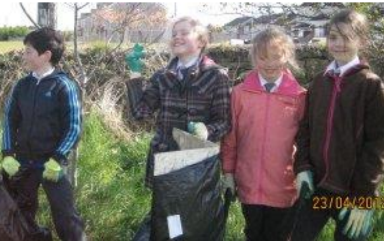
Rinne Rang 4 glanadh sa scoil