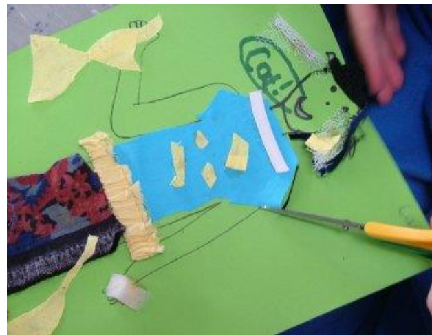
Is leor gnáth siosúr anois