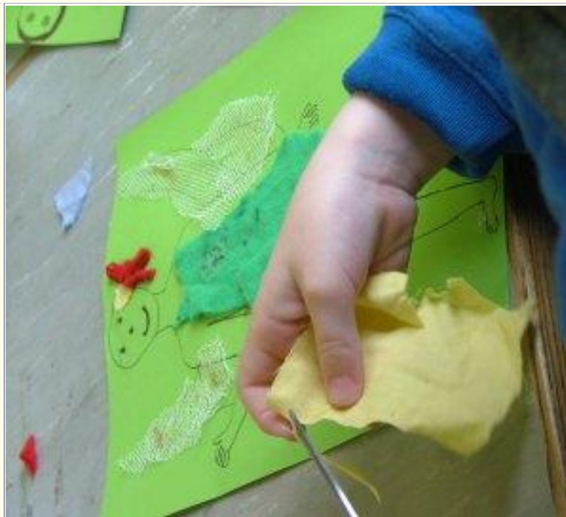
Cuir ar an teimpléad iad mar éadaí