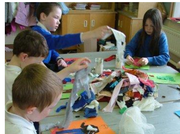
Bíodh rogha mhaith faibrice ar fáil