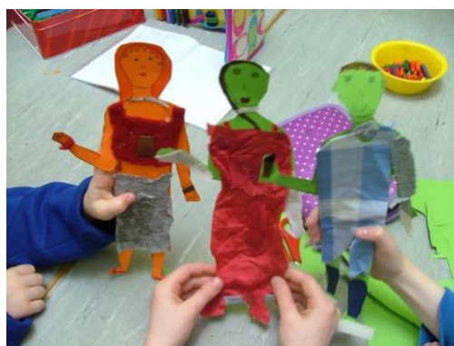
Agus seo triúir réidh don páráid faisin!