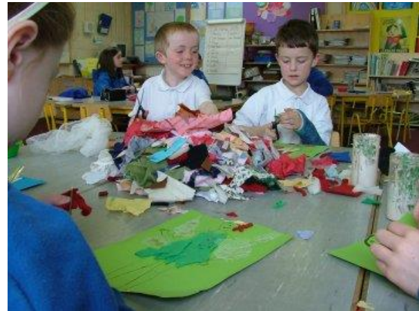
Bain úsáid as gliú láidir