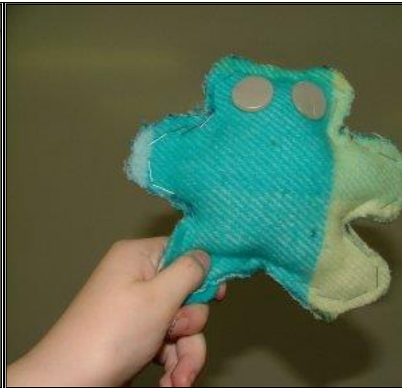
Rang 3, Feabhra 2008