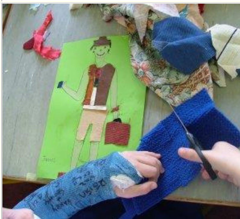
...agus bí cúramach leis