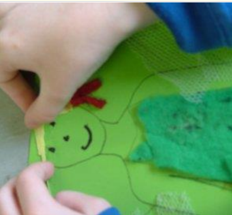
Gearr amach píosaí faibrice