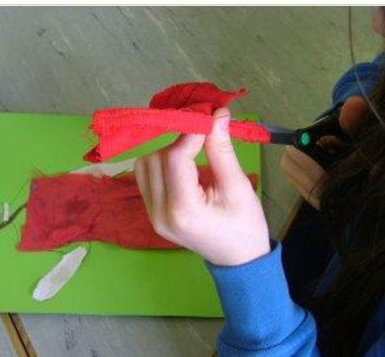
Bí cinnte go bhfuil siosúr maith agat...