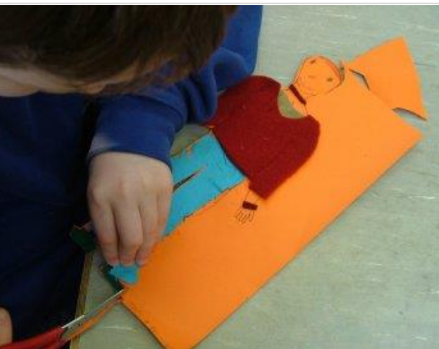
Gearr amach an duine