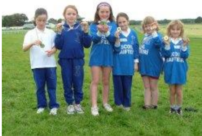
Baile an Róba, 2004. Clic anseo chun pictiúirí a fheiceáil.