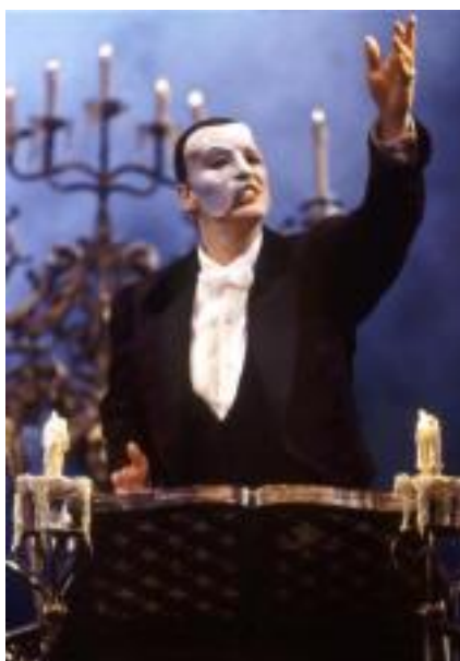
Come to the Phantom of the Opera Oíche amach sa phictiúrlann, Nollaig 10, 2004