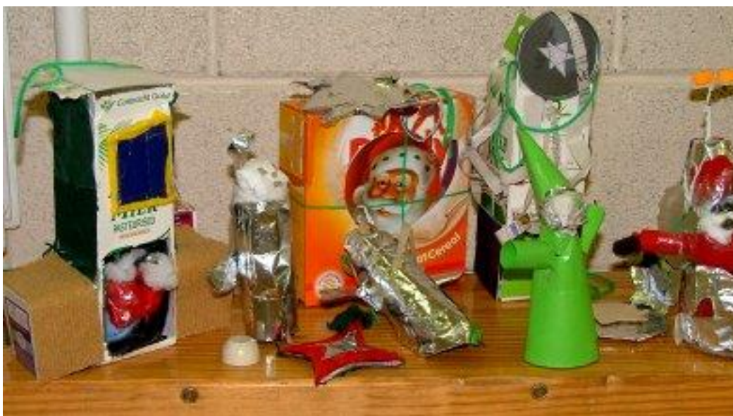
Maisiúchain don Nollaig déanta as bruscar, 2004