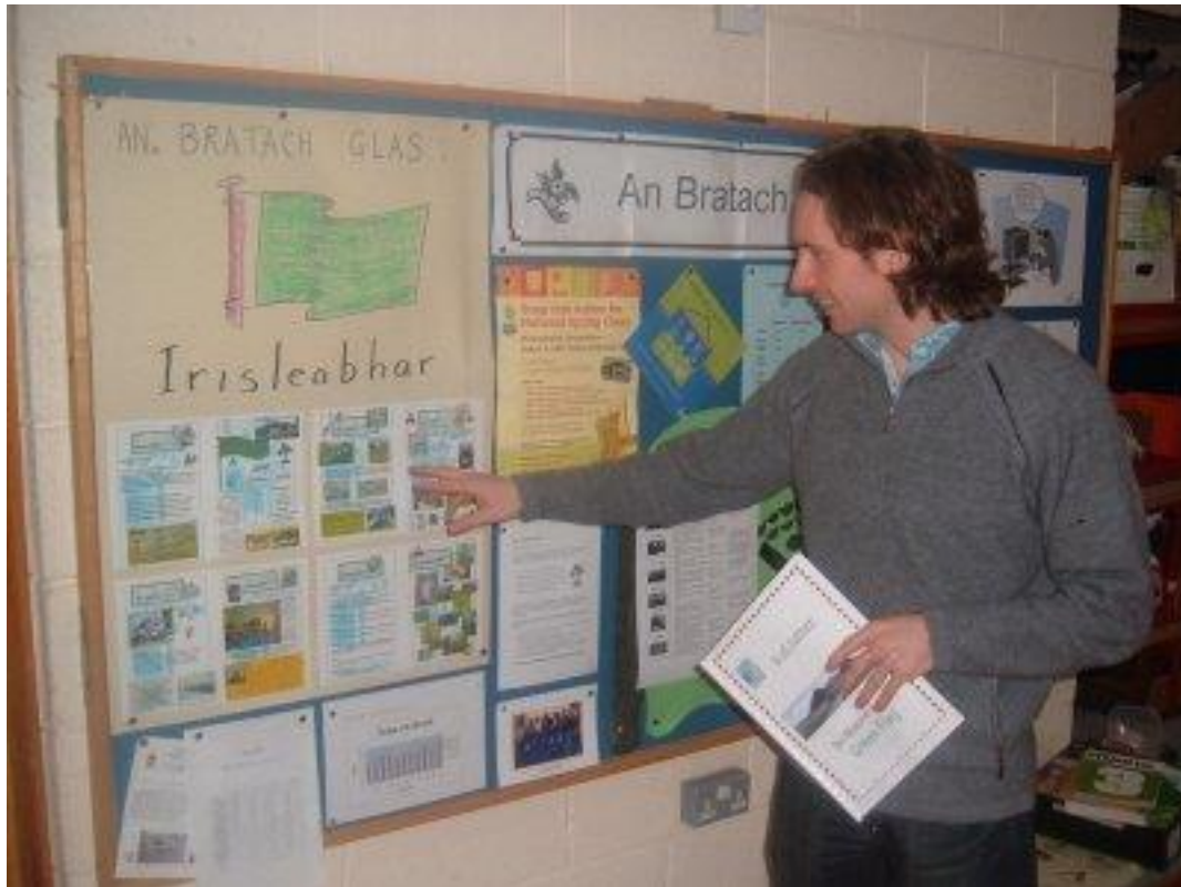
Seo Liam Ó Condúin ón Taisce chun scrúdú a dhéanamh ar Scoil Raifteirí chun fáil amach an bhfuil Bratach Glas nua tuillte againn.