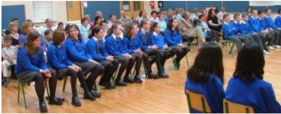
Aifreann Rang 6