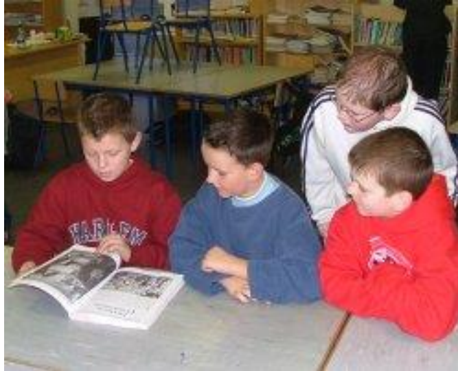
Seo páistí ag baint taitnimh as an lá gan sanéide scoile.