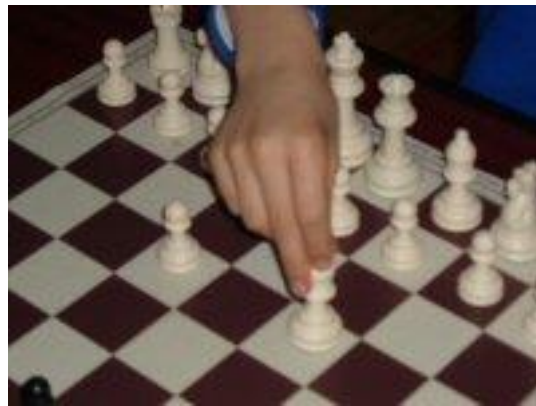
Chuaigh an fhoireann fichille go dtí Oileán Cliara. Clic anseo chun níos mó pictiúirí a fheiceáil.