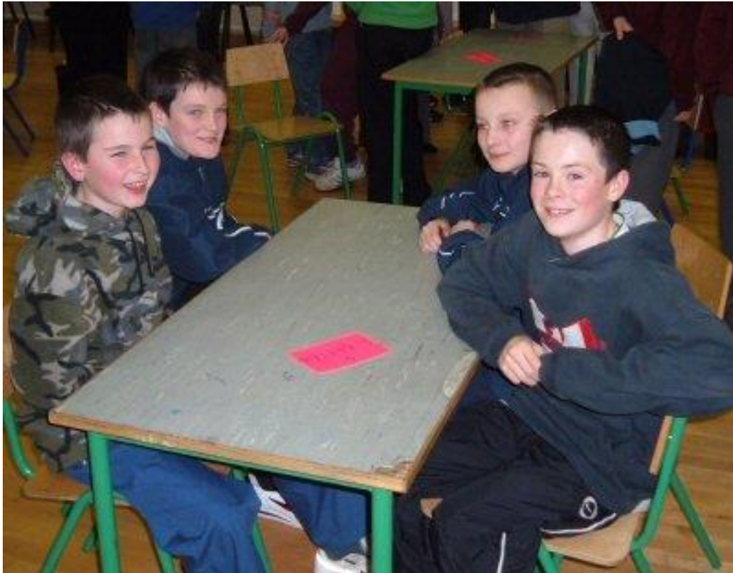
Tháinig foireann an scoile sa tríú áit