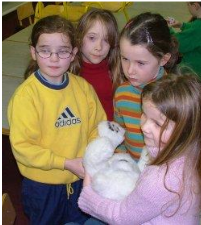
Funds collected for tsunami relief.