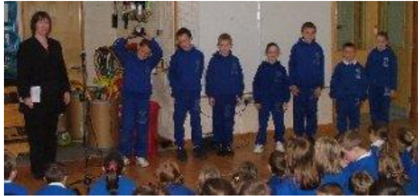
Seo na páistí a ghlac páirt i Labhairt na Gaeilge i bhFleadh Cheoil 2004.