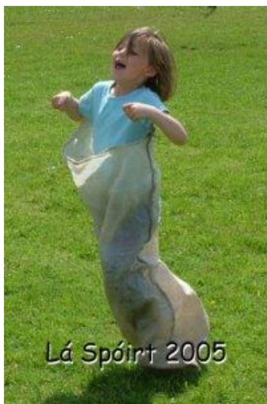
Lá Spóirt 2005