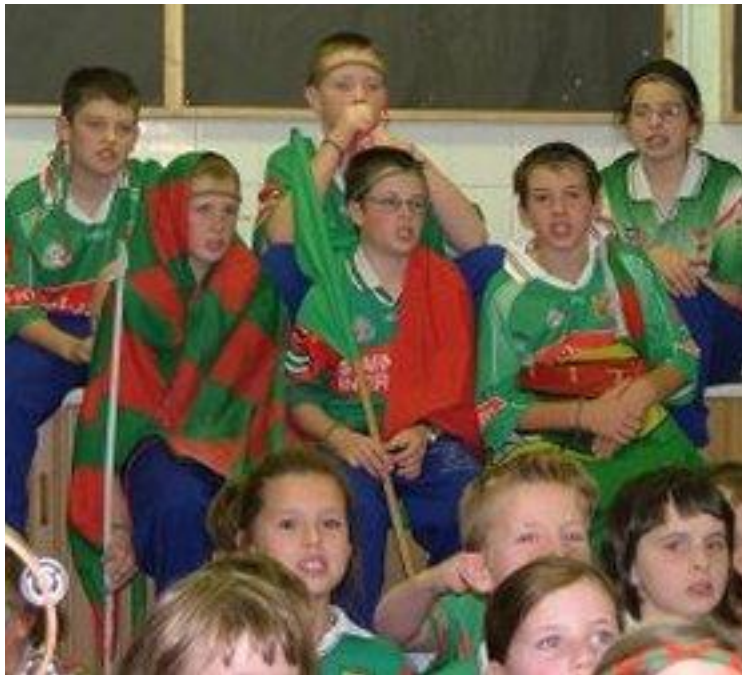
Sam 04: Clic anseo chun atmaisféar na scoile a fheiceáil.