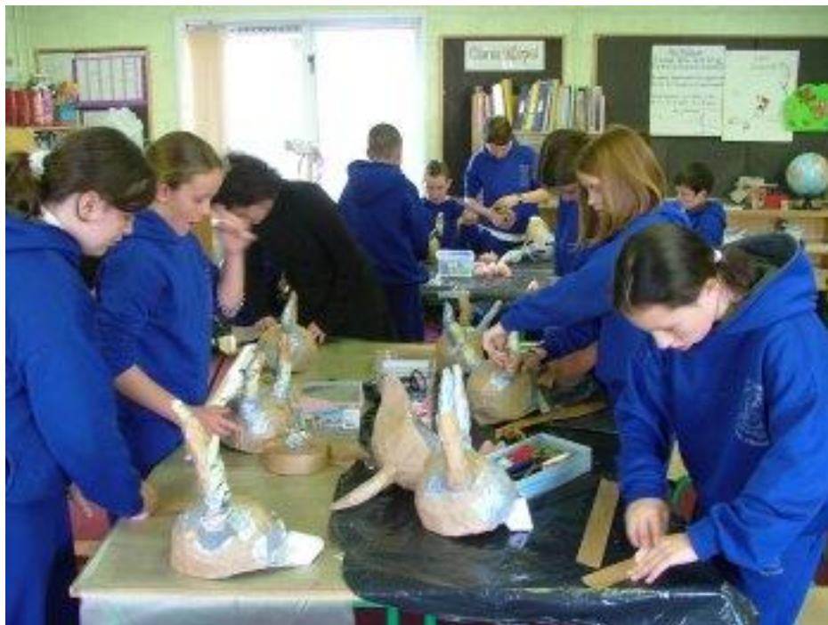
Tá Rang 6 ag ullmhú do Roola Boola