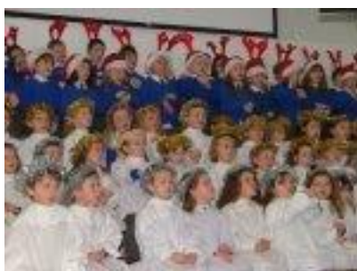
Ceolchoirm na Nollag, 12.12.04